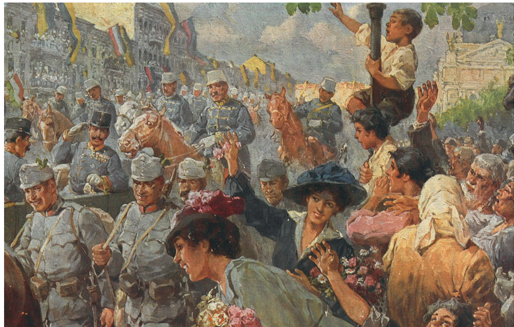
Nach der Wiedereroberung von Lemberg am 22. Juni 1915