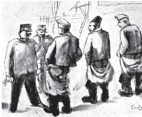
»Schwanzparade«: Ein Militärarzt untersucht die Genitalien der Soldaten auf Krankheitssymptome.