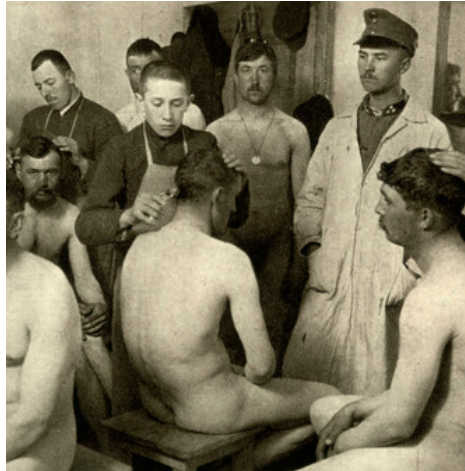
Desinfektion: Scheren der Mannschaft vor dem Bad

VENERISCHE ERKRANKUNGEN hatten während des Ersten Weltkriegs in allen beteiligten Armeen einen beträchtlichen Anstieg. Vor Kriegsausbruch litten 5,6 % der österreichisch-ungarischen Soldaten an einer Geschlechtskrankheit, 1915 waren es bereits 12,2 %. Eine Maßnahme bestand in den regelmäßigen Inspektionen der Truppe, umgangssprachlich auch als „Schwanzparade“ bezeichnet.