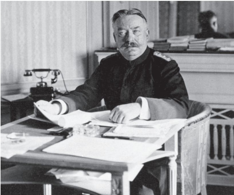
Hauptmann: »Die Geschlechtskrankheiten sind es, die uns Sorge bereiten.«