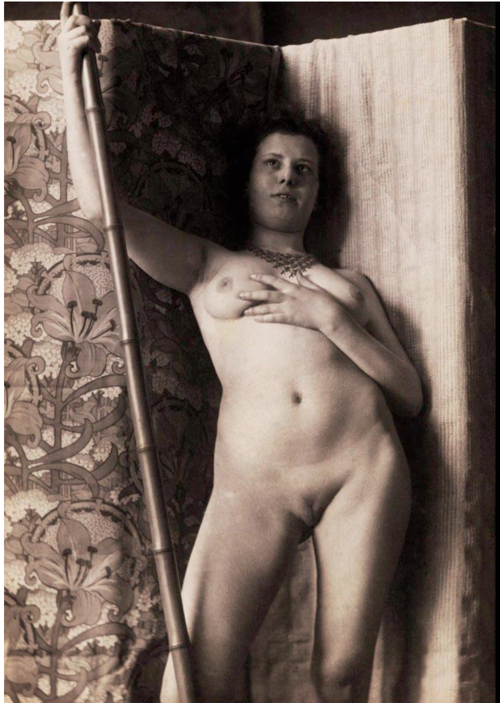
Prostituierte. »Bedenken wir, daß sich eine namhafte Anzahl Soldaten venerisch infiziert haben – «

Jetzt erzählen S', wie wir mit der Cholera fertig gworn sind.