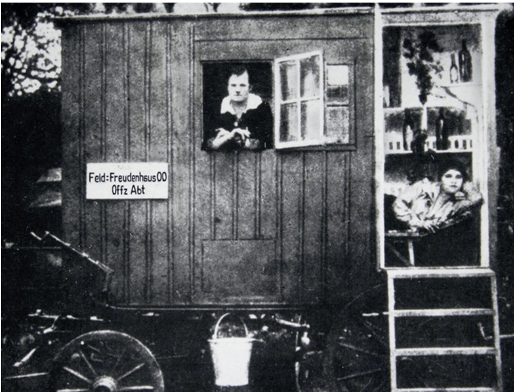
Mobiles Feldbordell. Prostitution war im Ersten Weltkrieg sehr verbreitet. Je nach Rang in der Armee gab es eigene Feldbordelle. Für die untersten Ränge wurden diese auch auf Heuböden eingerichtet.

Aus dem Arsenal des Kampfes gegen Geschlechtskrankheiten im Krieg.