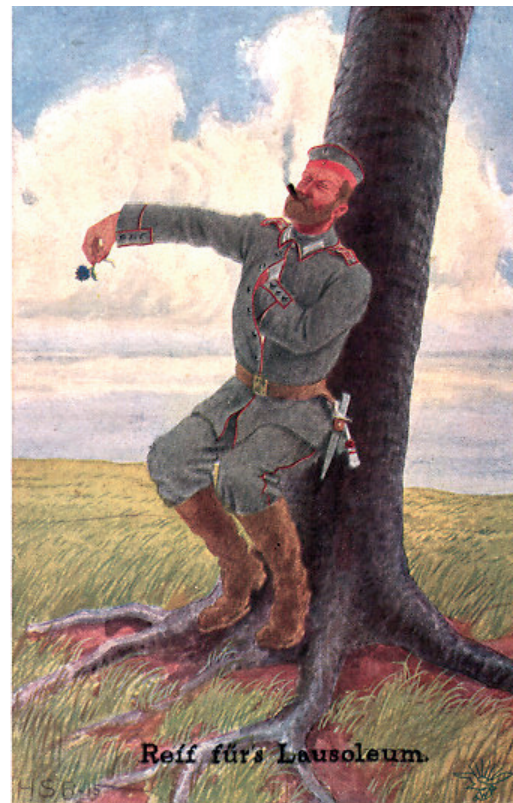
»Reif fürs Lausoleum« – Soldat kratzt sich am Baum.