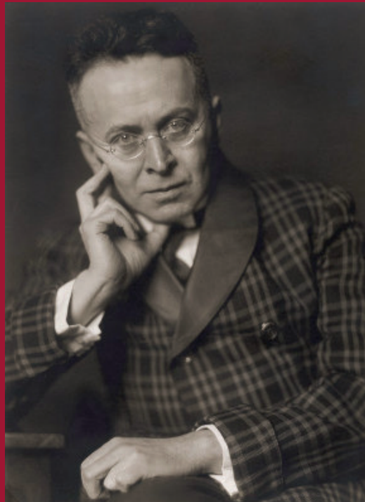
Nörgler: »Endlich einmal ein freundlicher Mann.«