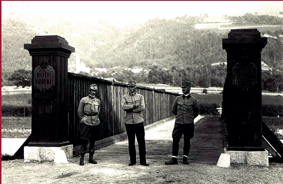
Vor einer Brücke

(in Rage) Jo – Wonn eins net holten tuat – da schiaß ma alls zsamm – schiaß ma alls zsamm –