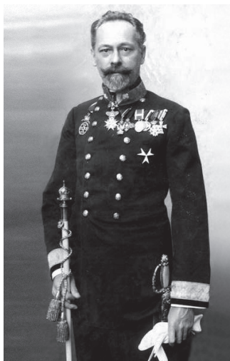
Hofrat Nepalleck*, Direktor des Hofzeremoniell-Departments

HOFRAF WILHELM NEPALLECK organisierte als Direktor des Hofzeremoniell-Departments die Begräbnisfeierlichkeiten des Thronfolgerpaares im Juli 1914. Die Überföhrung der Leichen von Wien nach Artstetten, dem Wohnsitz des Thronfolgers in Niederösterreich, verlief allerdings äußerst turbulent. Per Bahn waren die Särge in der Nacht auf den 4. Juli 1914 am Bahnhof Pöchlarn eingetroffen. Kurz darauf brach ein gewaltiges Gewitter los. Die Särge wurden im strömenden Regen auswaggoniert, Blitze zuckten auf, die sekundenlang den ganzen Ort mit grellem, fahlem Licht beleuchteten. Veteranen und freiwillige Feuerwehroleute amüsierten sich neben dem Vestiböl des kleinen Bahnhofsgebäudes bei Würstel und Bier, Herren mit Zigarren im Mund promenierten ungeniert in der Nähe der Särge, die stundenlang auf den Steinflüssen standen, bis man sie schliesslich in die Gruft von Artstetten brachte. Kaiser Franz Joseph teilte Fürst Montenuovo kurz danach in einem Belobigungsschreiben ausdrücklich seine Zufriedenheit »in Übereinstimmung mit meinen Intentionen« über die Begräbnisfeierlichkeiten mit.