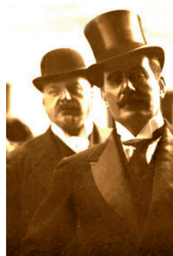
Angelo Eisner von Eisenhof* (rechts der Komponist Giacomo Puccini)