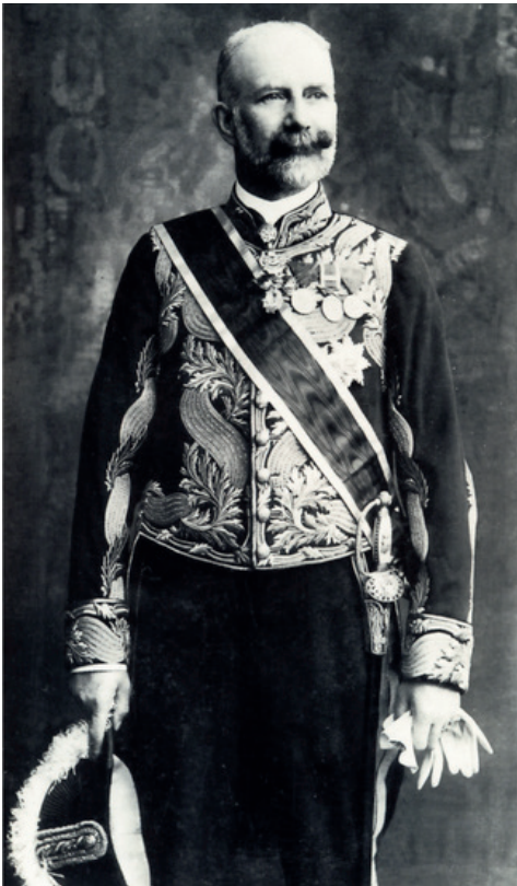
Obersthofmeister Fürst Montenuovo*