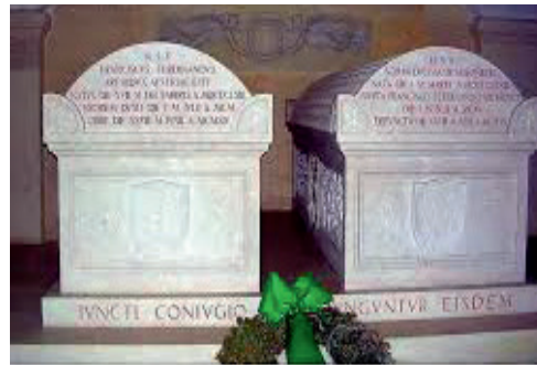
Die Sarkophage in der Gruft in Artstetten