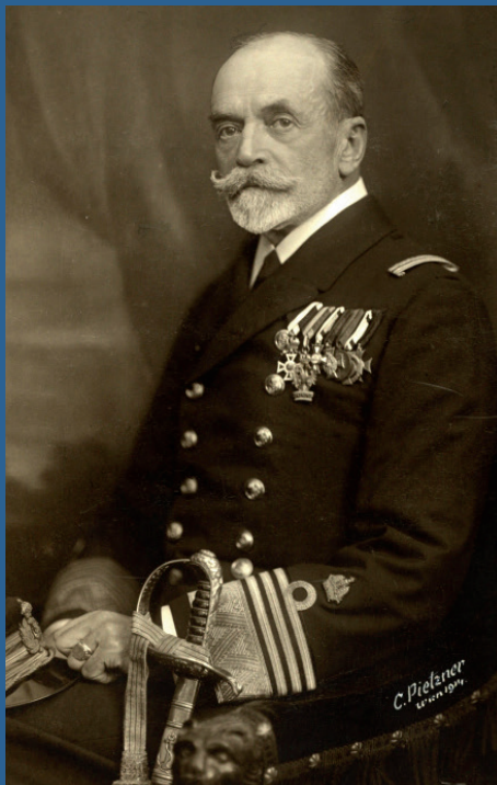
Anton Haus*, Oberbefehlshaber der Kriegsflotte

DER ABONNENT Fürwahr, eine stattliche Liste.