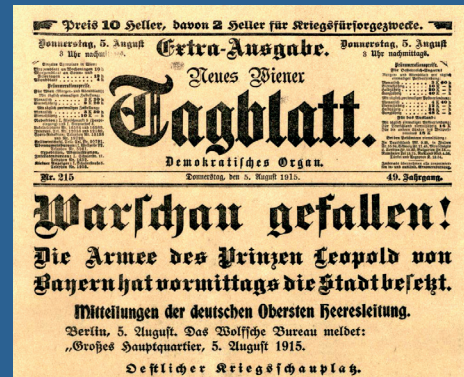
Nachricht vom Fall Warschau im August 1915