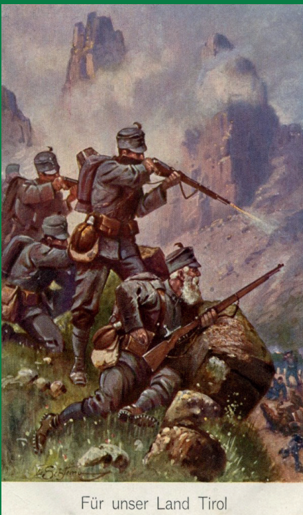
Für unser Land Tirol