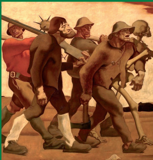
Albin Egger-Lienz: Totentanz