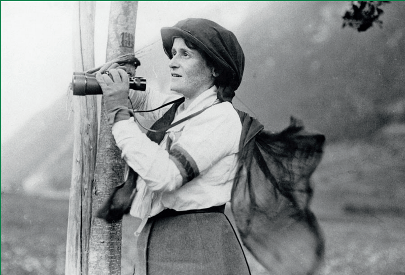
Kriegsberichtersteratterin Alice Schalek* an der Tiroler Front (1915): »Ich bin vom Fieber des Erlebens gepackt!«