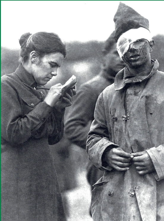
Alice Schalek interviewt einen verwundeten Soldaten (fiktives Photo)

ALICE SCHALEK war Kriegsberichtersteratterin und war die einzige Frau, die es ins Kriegspressequartier schaffte. Im Sommer 1915 erhielt sie die Erlaubnis zum Besuch der Front in den Tiroler Alpen, wo sie im Juli und August vier Wochen verbrachte. Von Bozen wurde sie gemeinsam mit anderen Kriegsberichtersteratern mit dem Lastwagen an verschiedene Frontabschnitte gefahren und verbrachte mehrere Tage im Bergdorf Trafoi im Vinschgau. Sie unternahm einen Aufstieg auf den strategisch wichtigen Monte Scorzuzo und verbrachte in der auf über 3000 Meter gelegenen Stellung mehrere Tage. Sie erregte damit großes Erstaunen, denn keiner der anderen Kriegsberichtersteratter war vorher dorthin gekommen. In der Folge besuchte sie auch noch die Fronten in den Dolomiten und im Trentino bei Lavarone; an diesen sehr unruhigen Frontabschnitten konnte sie mehrmals Gefechte mit Granatenfeuer beobachten.