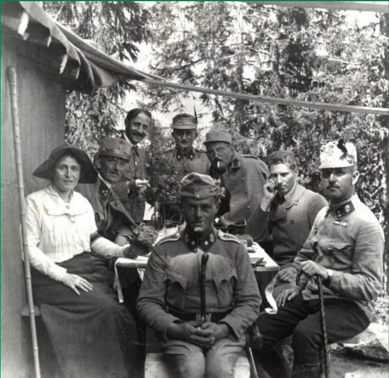
Alice Schalek* in Südtirol (1915): »Nennt es Vaterlandsliebe, Feindeshaß, Sport, Abenteuer – ich nenne es frei gewordenes Menschentum!«

Beobachter, die Kriegsberichterstatterin Alice Schalek, Tiroler Standschütze, Offizier, Ordonnanz die den Tod Hofers meldet, Soldaten mit einer Bahre auf der eine Leiche liegt, Mitglieder des Kriegspressequartiers