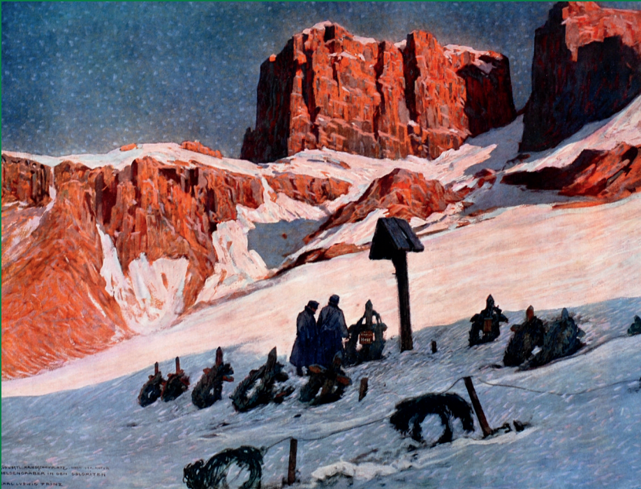
Heldengräber in den Dolomiten. Südwestlicher Kriegsschauplatz (nach der Natur von Karl L. Prinz)