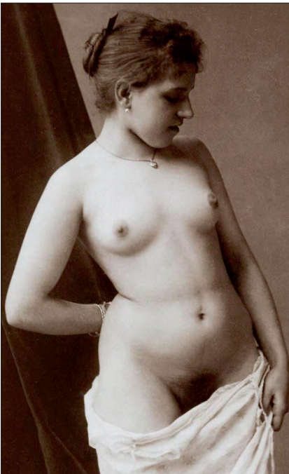
Schlamerl des Fabrikanten

»IN DEN TAGEN, DA DIE KRIEGSFURIE AM WILDESTEN raste, mußte die Arbeiterschaft die tiefste Schmach erdulden. Sofort mit Beginn des Krieges wurde eine große Anzahl von Fabriken unter das Kriegsdienstleistungsgesetz gestellt; und je länger der große Mord dauerte, desto größer wurde die Zahl der Betriebe und die Masse der Arbeiter, auf die dieses Gesetz ausgedehnt wurde. Durch dieses Gesetz wurden die Arbeiter einfach zu Arbeitstieren herabgewürdigt. In den Betrieben herrschte die Soldateska mit aller Brutalität, deren sie fähig ist. Die Roheit der militärischen Leiter, wie diese Fronvögte der Kriegsindustrie genannt wurden, kannte keine Grenzen und die Arbeiter, die diesen Schiebern ausgeliefert waren, mußten die Bestialitäten ertragen. Sie waren durch das Gesetz wehrlos und wehe dem Arbeiter, der sich hätte hinreißen lassen, sich gegen seine Peiniger aufzubauen. Das Anbinden war die mildeste Strafe; schwere Kerkerstrafen, Stockhiebe, Verschickung an die Front waren die üblichsten Mittel, mit denen die Arbeiter gezwungen wurden, die Schmach, die ihnen täglich von den militärischen Leitern angetan wurde, ruhig hinzunehmen. Mit Kerkerstrafen und Bajonetten wurde jeder Widerstand von vornherein unmöglich gemacht. Gewalt ging vor Recht. Und die Gewalt der militärischen Machthaber war grenzenlos.« (»Arbeiterzeitung«, Januar 1920)