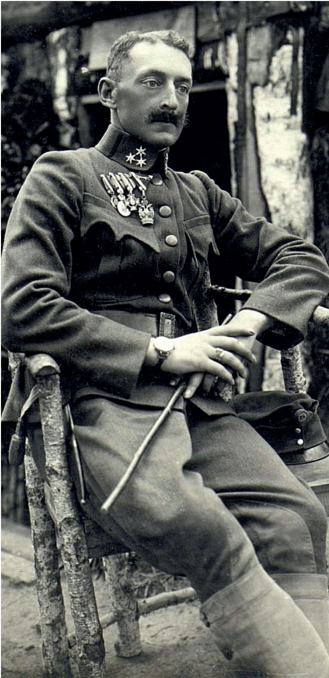
Militärischer Leiter: »Solang es geht, versuch ichs in Güte.«

Eine unter das Kriegsdienstleistungsgesetz gestellte Fabrik. Militärischer Leiter, Fabrikant (mit einer Hundepfeitsche)