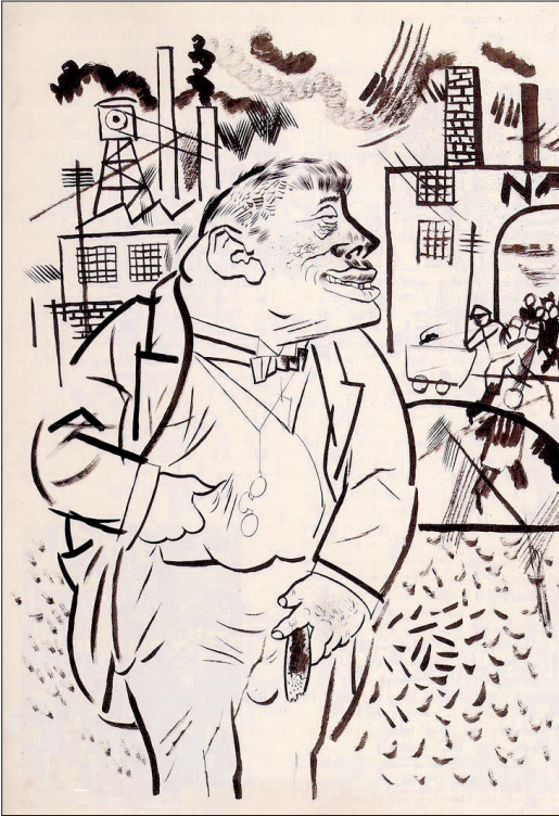
Fabrikant: »Da soll man keine Peitsche bei sich haben.«